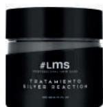
CONDITIONER X 200 SILVER REACTION