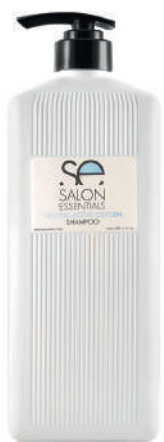
SHAMPOO X 1500 NEUTRAL