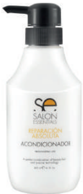
ACONDICIONADOR X 400 REP ABS

Repairs, nourishes and untangles intensely. It works on the capillary structure, strengthening the hair, providing a high degree of nutrition. This conditioner works from within the cells. Essential product to achieve resistant and shiny hair.