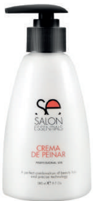
CREMA DE PEINAR X 280

This moisturizing formula creates loose, soft, natural-feeling styles. Conditions, moisturizes and fights frizz, especially for dry hair. It is essential for the creation of natural styles, whether dried with a diffuser or left to dry naturally. It is ideal to tame your hair day by day.