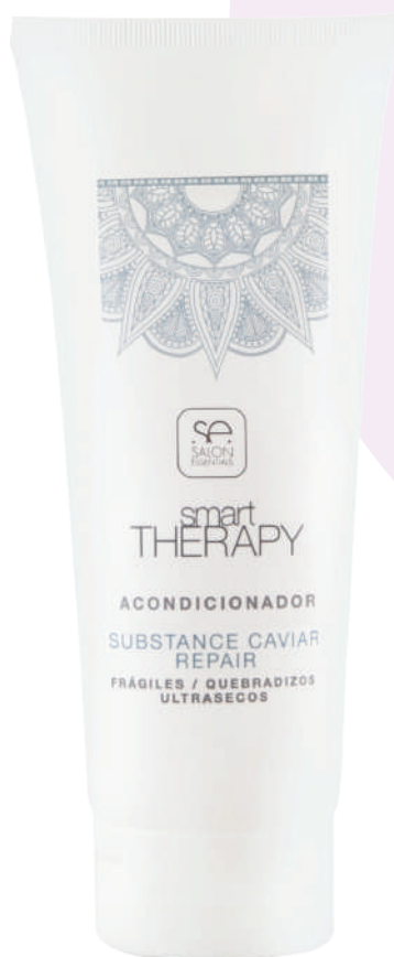
CONDITIONER X250 CAVIAR REPAIR

Detangles and conditions hair. Hydrates, nourishes and repairs dry and damaged hair. Suitable for repairing all types of hair exposed to chemical treatments, external threats or the heat of dryers or irons. Its formula enriched with caviar gives it a high restorative power.