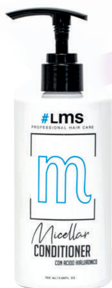
CONDITIONER X320 MICELLAR

Condition dull hair after washing with Micellar Shampoo #LMS, provides great moisture and nutrition due to the presence of Hyaluronic Acid and Amino Acids of keratin and panthenol.