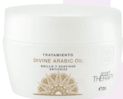
TREATMENT X250 DIVINE ARABIC OIL

High nutritional power and long lasting treatment. Provides vitality and prolonged protection to the hair. The most sophisticated first class technology with Argan Oil makes this treatment an essential product to hydrate, soften and add shine to the hair.