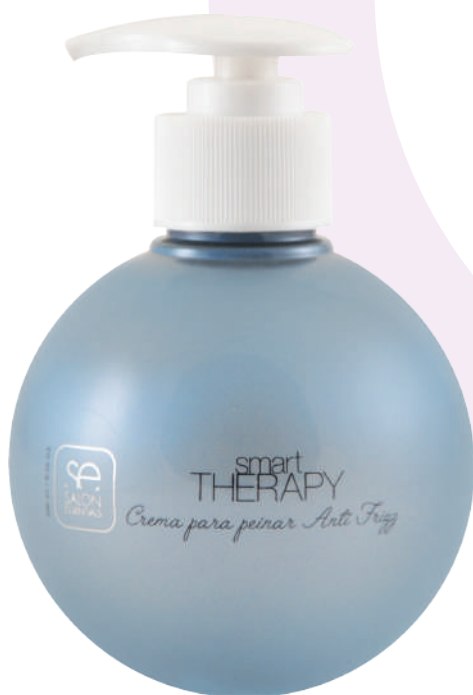
CREMA PARA PEINAR X250 ANTI FRIZZ

This moisturizing formula creates loose, soft, natural-feeling styles. Conditions, moisturizes and fights frizz, especially for dry hair. It is essential for the creation of natural styles, whether dried with a diffuser or left to dry naturally. It is ideal to tame your hair day by day.