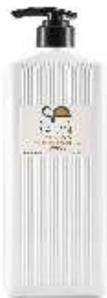
SHAMPOO X 1500 REP ABS