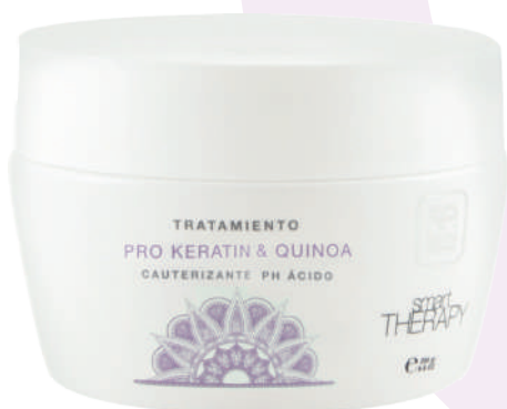
TREATMENT X250 PRO KERA & QUINOA

Intensive treatment exclusively developed to protect, maintain and enhance the color of dyed hair. Provides a high degree of nutrition. Seals the color pigments to the hair fiber. Its formula developed with first class high technology and enriched with keratin fixes the color pigments.