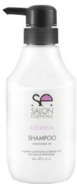
SHAMPOO X 400 KERATINA

Restore from within. Its added keratin strengthens the hair fiber, achieving healthy and shiny hair.