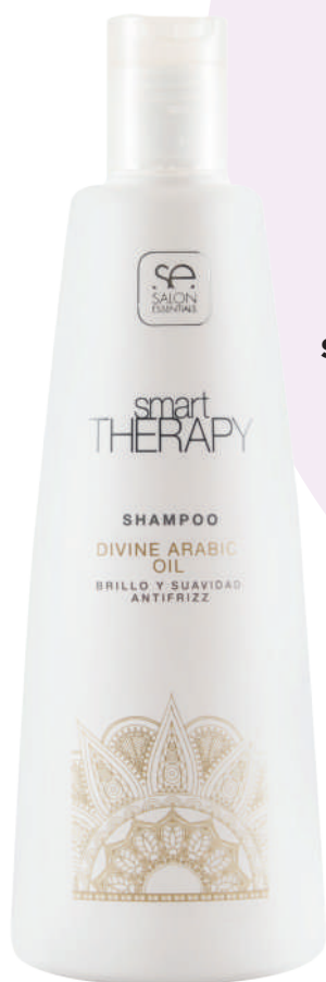
SHAMPOO X330 DIVINE ARABIC OIL

Anti-frizz shine and softness. Deeply cleanses the hair and scalp. Its exclusive formula with Argan Oil leaves hair noticeably shiny and soft to the touch. Thanks to its first class technology, the results are quickly noticeable on the hair. Incredible shine and smoothness guaranteed.