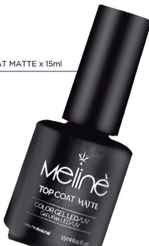
TOP COAT MATTE x 15ml