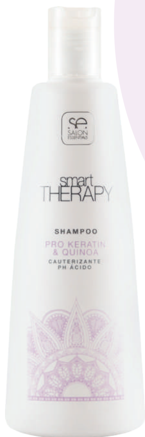
SHAMPOO X330 PRO KERA & QUINOA

Deeply cleanses the hair and scalp. With its acidic pH, it seals the hair fiber while firmly holding the color pigments. Its formula enriched with Quinoa provides hydration and, above all, a high repairing power that, together with keratin, restores elasticity and shine to damaged hair.