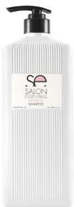
SHAMPOO X 1500 KERATINA