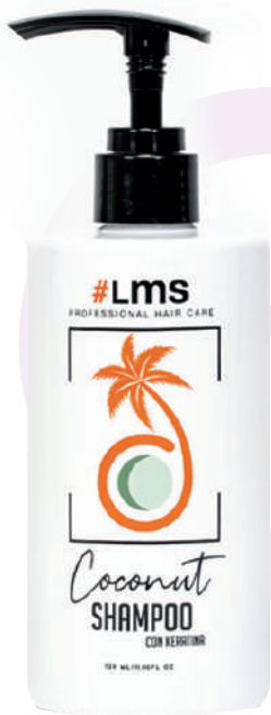
SHAMPOO X320 COCONUT

Cleanses and conditions oily hair, provides great cleaning and clarification due to the presence of coconut extract, while protecting the ends by the action of the keratin hydrolyzate.