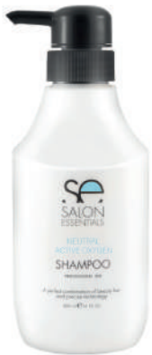
SHAMPOO X 400 NEUTRAL

Recovers the structure of the hair and reconstitutes the hair fiber, achieving a balanced PH for all types of hair.