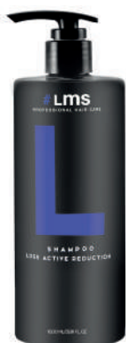
SHAMPOO X1000 LOSS ACTIVE REDUCTION