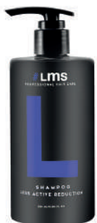
SHAMPOO X320 LOSS ACTIVE REDUCTION