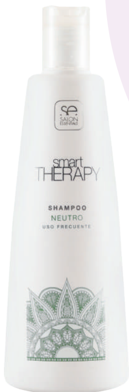
SHAMPOO X330 NEUTRO V

Generates a deep cleaning resulting in soft, luminous hair free of residue and impurities. Recommended for daily use. Its formula, suitable for daily use, is ideal for use after chemical treatments such as straightening, coloring, keratin shock, so that the hair recovers the altered pH during these processes. long-lasting.