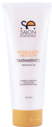
TRATAMIENTO X 500 REP ABS