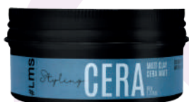
CERA MATT CLAY X80

Matt Clay for molding, texturizing and leaves a dry finish. Adds texture and definition to the hair. Apply over dry or wet hair.