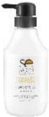
SHAMPOO X 400 REP ABS

The hair fiber is instantly transformed, obtaining greater resistance, elasticity and shine, strengthening the structure of hair cells.