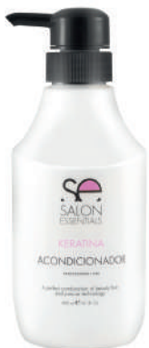
CONDITIONER X 400 KERATINA

Nourishes hair, bringing shine and softness. Its formula enriched with Keratin brings vitality to the hair fiber, leaving the hair with luminosity.