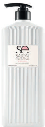
CONDITIONER X 1500 KERATINA