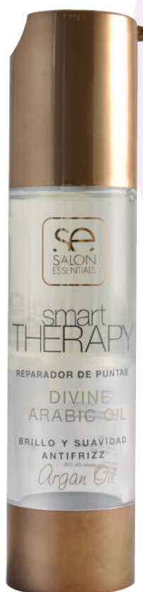
REPARADOR PUNTAS X60 DIVINE ARAB OIL

The vitamins nourish the hair while the Argan oil from Morocco helps the production of keratin and retain moisture in the hair structure. Place a few drops in the palms of your hands and apply to the ends of your hair, after washing.