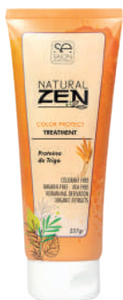
TREATMENT X237 COLOR PROTECT