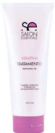
TREATMENT X 500 KERATINA