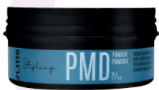
POMADA PMD X80

Place the desired amount in the palm of your hand, rub and apply to lightly towel-dried hair, spread and comb or shape with your fingers, until you achieve the desired result. Finish with hair dryer for better results.