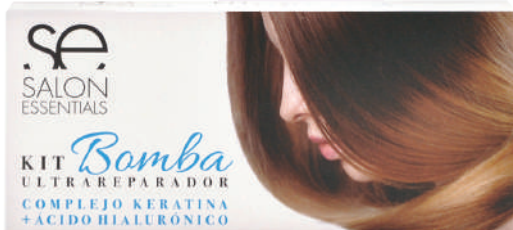
KIT BOMBA ULTRA REPARADOR

Kit containing 2 Shampoos, 2 Treatments and 2 Ampoules. A restorative treatment with hyaluronic acid that rebuilds the hair, repairing damage and providing shine and nutrition from root to tips.