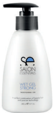
WET GEL STRONG X 280

For use on wet or dry hair. After shampooing and conditioning, towel dry and apply Wet Gel Strong to your hair. Use hair dryer for drying and styling to your liking. If a wet look is desired, allow hair to dry naturally.