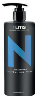
SHAMPOO X1000 NEUTRAL PURIFYNG