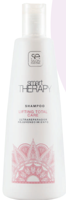
SHAMPOO X330 LIFT TOTAL CARE

Deeply cleanses the hair and scalp. It has exclusive repair properties that prevent the passage of time from being noticeable on the hair. Ideal for worn and mature hair. Returns shine and softness.