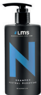
SHAMPOO X320 NEUTRAL PURIFYING