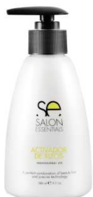
ACTIVADOR DE RIZOS X 280

It is an easy-to-use product, both for the professional and for the home user. It is a perfect styling product for activating waves, to recreate and maintain the hair style with natural curls. Provides definition and elasticity.