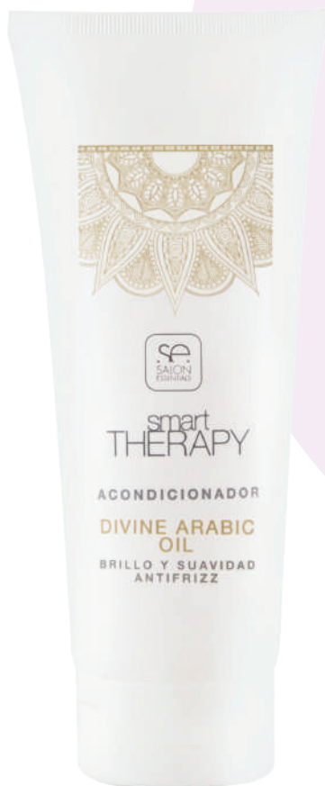
CONDITIONER X235 DIVINE ARABIC OIL

Detangles and conditions hair leaving it noticeably soft. Gives hair extreme luminosity thanks to its exclusive formula with Argan Oil. Provides the exact degree of shine and softness, leaving hair smooth and untangled.