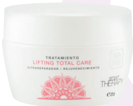
TREATMENT X250 LIFT TOTAL CARE

Exclusive treatment to face the passage of time. It defies the signs of aging of the hair fiber with its first class high-tech formula. Repairs and intensely protects the hair, giving it strength and rejuvenating it.