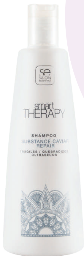
SHAMPOO X330 CAVIAR REPAIR

Formulated for fragile, brittle and ultra-dry hair. Deeply cleanses the hair and scalp. Restores the hair fiber to the maximum, restoring the shine and volume of the hair. Provides high levels of nutrition, protection and repair.