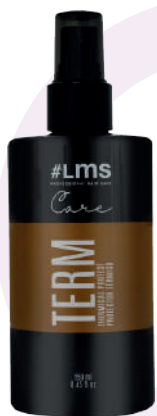
PROTECTOR TÉRMICO TERM X250

Spray for termal protection against the heat of the iron plates. Strengthens the hair fiber, provides hydration and nutrition. Improves the softness of the hair once the heat exposure process is finished. Resistant to heat up to 220C.