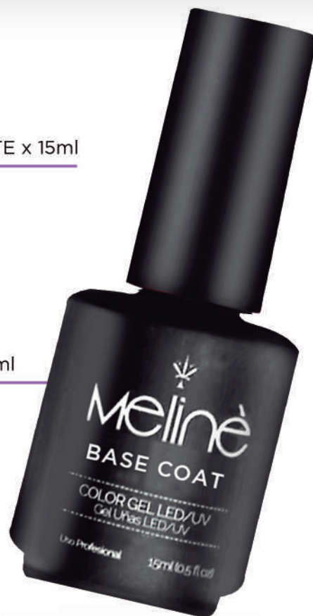
BASE COAT x 15ml