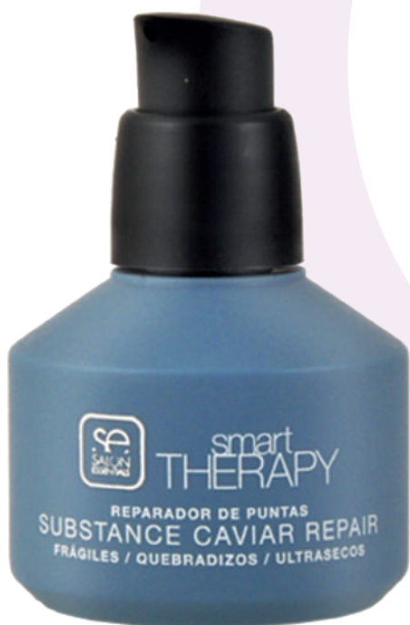
REPARADOR PUNTAS X60 SUBS CAVIAR REPAIR

Provides shine and softness to the hair. Closes the hair cuticles with an excellent anti-frizz effect. The final touch for a perfect look. Apply to damp or dry hair, spreading from mid-lengths to ends. Not greasy.