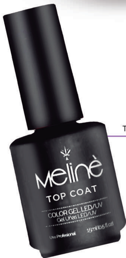
TOP COAT x 15ml