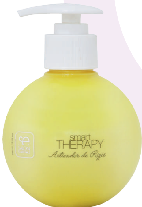
ACTIVADOR DE RIZOS X250

Curl activator with a special formula to create lasting curls and control frizzy hair. It is an easy-to-use product, both for the professional and for the home user. It is a perfect styling product for activating waves, to recreate and maintain the hair style with natural curls. Provides definition and elasticity.