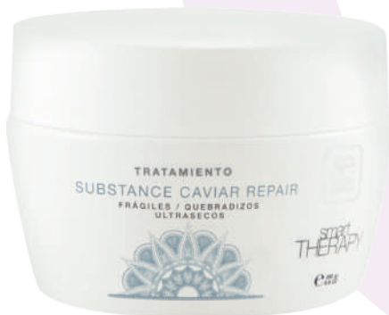
TREATMENT X250 CAVIAR REPAIR

Intensive treatment exclusively developed to protect, maintain and enhance the color of dyed hair. Provides a high degree of nutrition. Seals the color pigments to the hair fiber. Its formula developed with first class high technology and enriched with keratin fixes the color pigments.