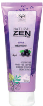
TREATMENT X237 REPAIR