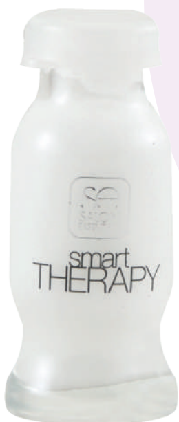
AMP X12ml SUBS CAVIAR REPAIR

Fast-acting hair ampoule that provides a high degree of repair and protection for damaged hair. Single and uniform application concentrate. After washing the hair and applying conditioner, pour the entire ampoule, spreading them throughout the hair, leave for 2 to 3 minutes and rinse with warm water.