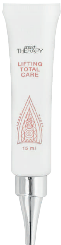
AMP X15ml LIFT TOTAL CARE

Instant action concentrate for the restoration of the hair fiber. Ampoule that acts quickly repairing and slowing down the signs of aging. The first-rate technology used to make this excellent product makes its results instantaneous and long-lasting.