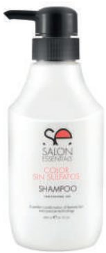
SHAMPOO X 400 COLOR S/SULF

Cleans and restores colored hair. It retains the color for much longer.