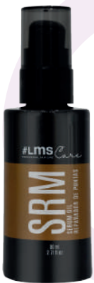
SERUM REPARADOR PUNTAS SRM x80

This leave-on serum smoothes and nourishes hair. It repairs split ends leaving the hair soft at touch, silky and with a natural movement.