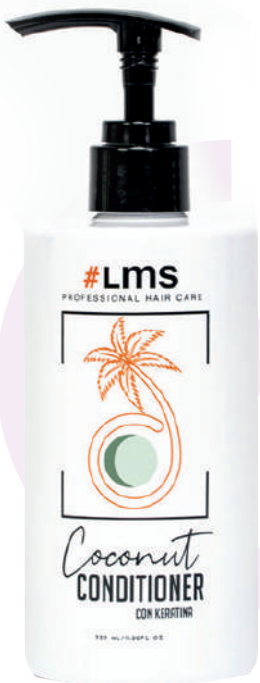
CONDITIONER X320 COCONUT

Condition after washing with #LMS Coconut Shampoo. For oily hair, it provides conditioning due to the presence of coconut extract and oil, while protecting the ends by the action of the keratin hydrolyzate.