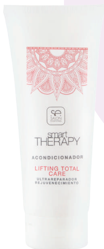
CONDITIONER X235 LIFT TOTAL CARE

Detangles and conditions mature hair. It gives strength to protect it from environmental threats and nourishes it to achieve hair fiber rejuvenation. Reconstructs the capillary structure, fighting the signs of age.