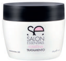
TREATMENT X 237 KERATINA

Corrective and restorative treatment. Produces intense nutrition. This formula, enriched with keratin, provides vitality, prevents frizz and reduces static.