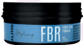
POMADA FIBER GUM X80

LMS Fiber Gum is a rubber with fibrous texture that provides control and shape to the hairstyle. Elastic rubber to mold finishes. A luxury ally for male hairstyles. Control resistant fiber. It leaves no residue and does not grease the hair.