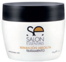
TRATAMIENTO X 237 REP ABS

Intensive repair treatment that penetrates and rebuilds damaged hair, working on the hair structure, providing a high degree of nutrition.