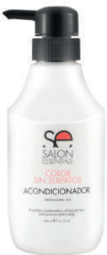
CONDITIONER X 400 COLOR S/SULF

For continuously colored hair. Achieves a protective film that lengthens the durability of the color.