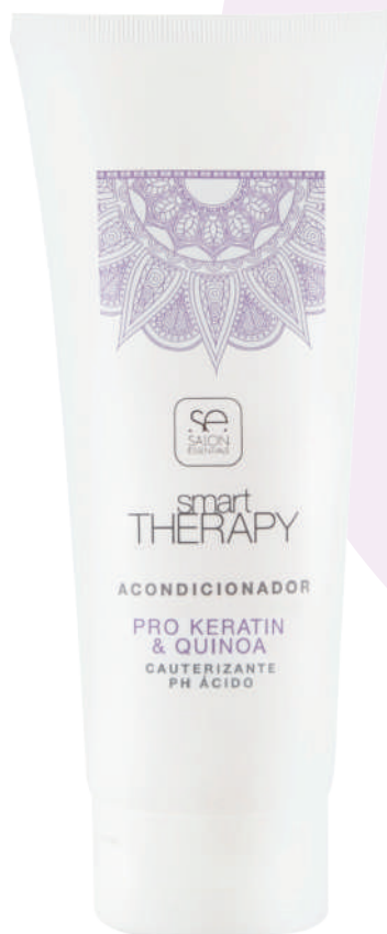
CONDITIONER X250 PRO KERA & QUINOA

Conditions and detangles. It keeps the color of the hair alive, giving it shine and softness. Provides a lot of shine to the hair and strong color retention. The cuticle is strengthened from within and the elasticity lasts.