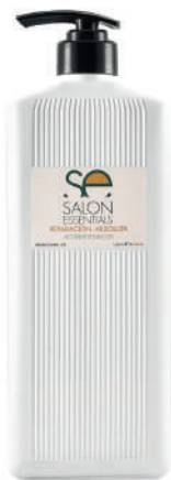
ACONDICIONADOR X 1500 REP ABS