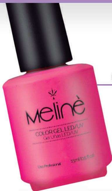
ESMALTE SEMI PERMANENTE x 15ml